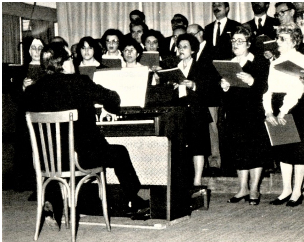
Alcuni componenti della Corale